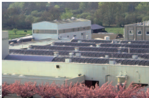
Le centre de recherche du Cerdatto à Serquigny dans l'Eure.

Il est possible de faire des panneaux flexibles en remplaçant les galettes de silicium par de minces couches photovoltaïques collées sur une surface flexible. Le verre qui couvre habituellement le panneau est alors remplacé par un film plastique. Cette technologie est déjà utilisée sur des membranes d'étanchéité photovoltaïques de toits industriels, par exemple.